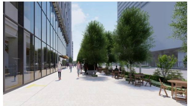
道路上での食事施設・休憩施設の設置イメージ