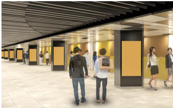
大阪駅前地下道のデジタルサイネージ、壁面広告