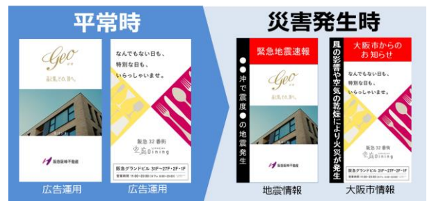
デジタルサイネージは災害時に広告から災害情報に自動切替